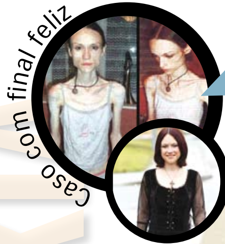
Caso com final feliz

A imprensa é apontada como uma das grandes causadoras de distúrbios alimentares em jovens pelo simples facto de 'impor' padrões de beleza difíceis de serem seguidos, quase fantasiosos. Porém, as próprias personalidades das revistas, jornais, programas televisão, moda e música têm assumido que sofrem de bulimia. Conheça os casos de alguns famosos que tiveram esta doença, como reflexo do meio onde trabalham: