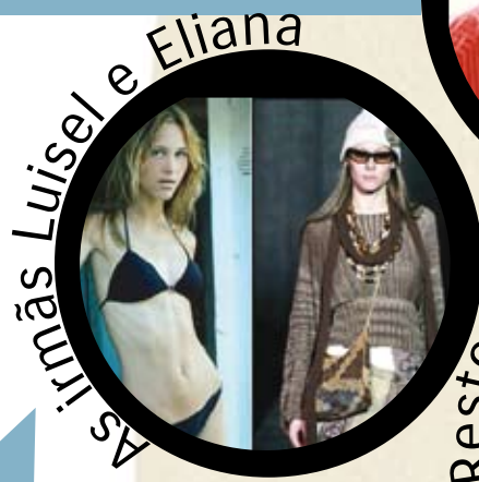
As irmãs Luísel e Eliana

As irmãs modelos uruguaias faleceram, uma em 2006 e outra em 2007, em consequência de anorexia nervosa. Partiram com um intervalo de seis meses.